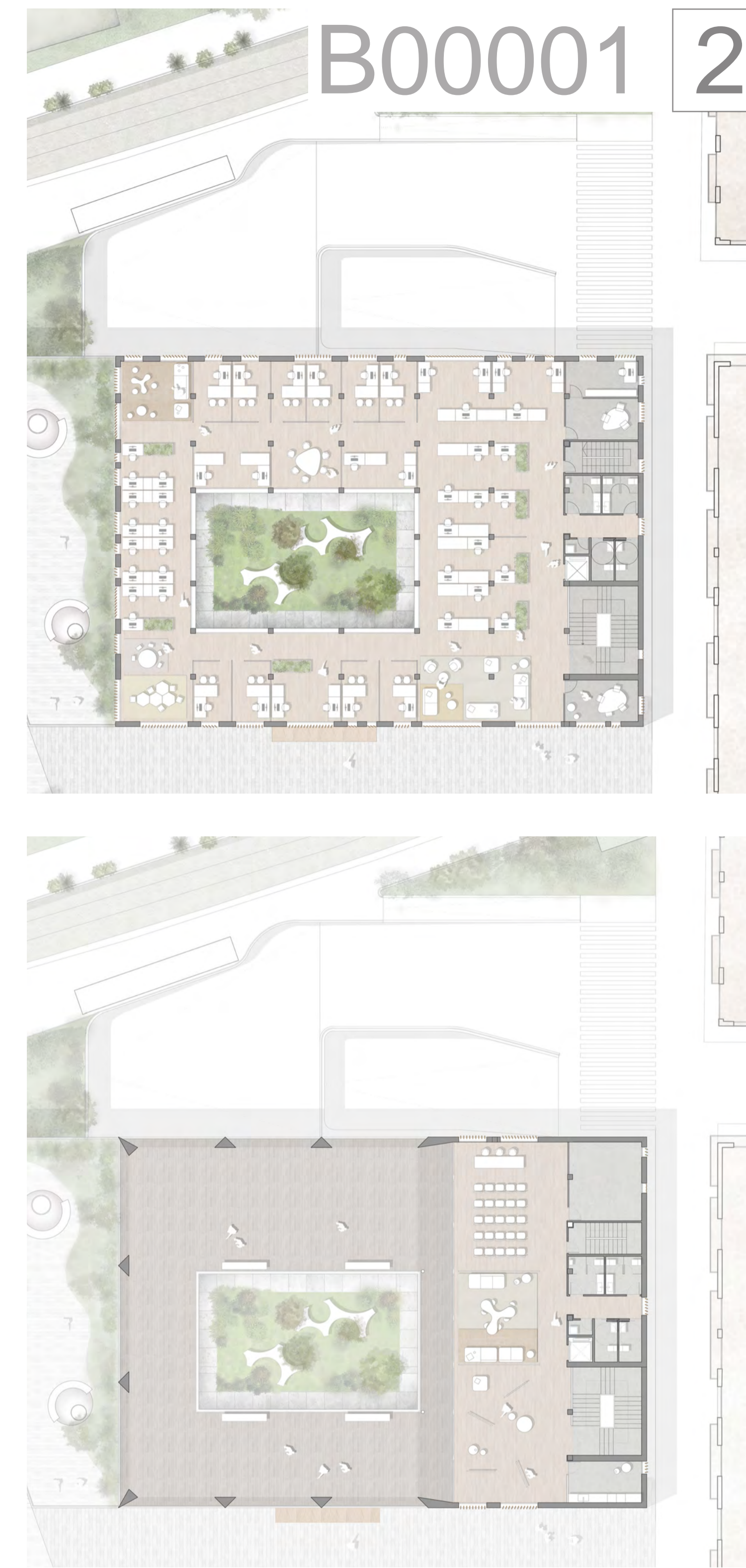
E: 1/250 0 1 5 10 15 20 25 PLANTA SEGUNDA Y TERCERA